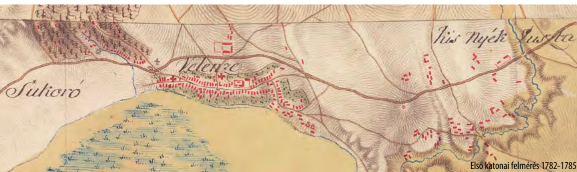
Első katonai felmérés 1782-1785