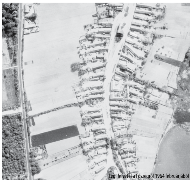
Légi felvétel a Főszegről 1964 februárjából

minden település kialakulásának kezdetén, a templom környezetében épültek az első házak. Ezeket főleg halászok és gazdálkodók lakták akkoriban. A régi térképeken (az első 1782-ből) látható, hogy milyen kevés épület volt még az egykori ősi templom, a Meszleny-Bod kápolna környékén. 1880 táján már 14 ház helyezkedett el, majd ez a szám mára 23-ra növekedett. Az akkor itt