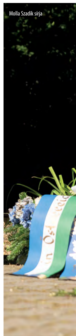
Molla Szadik sírja