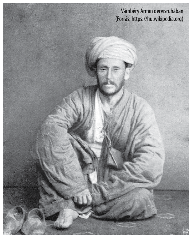
Vámbéry Ármin dervisruhában

Napilapok rövid hírei szerint 1871-re már nős volt, egy nagykanizsai esztergályos lányát vette el. Két gyermeke is született, egy Fatime nevű lány és egy Iszkender nevű fiú, akiket római katolikus hitben nevelt annak ellenére, hogy maga sohasem tért át. Bár a lapok híradásaiból úgy tűnik, hogy a mindinkább csak Molla Izsákként emlegetett özbeg férfiú egyre otthonosabban érezte magát Magyarországon, a honvágy csak nem hagyta nyugodni és haza szeretett volna látogatni. Azt