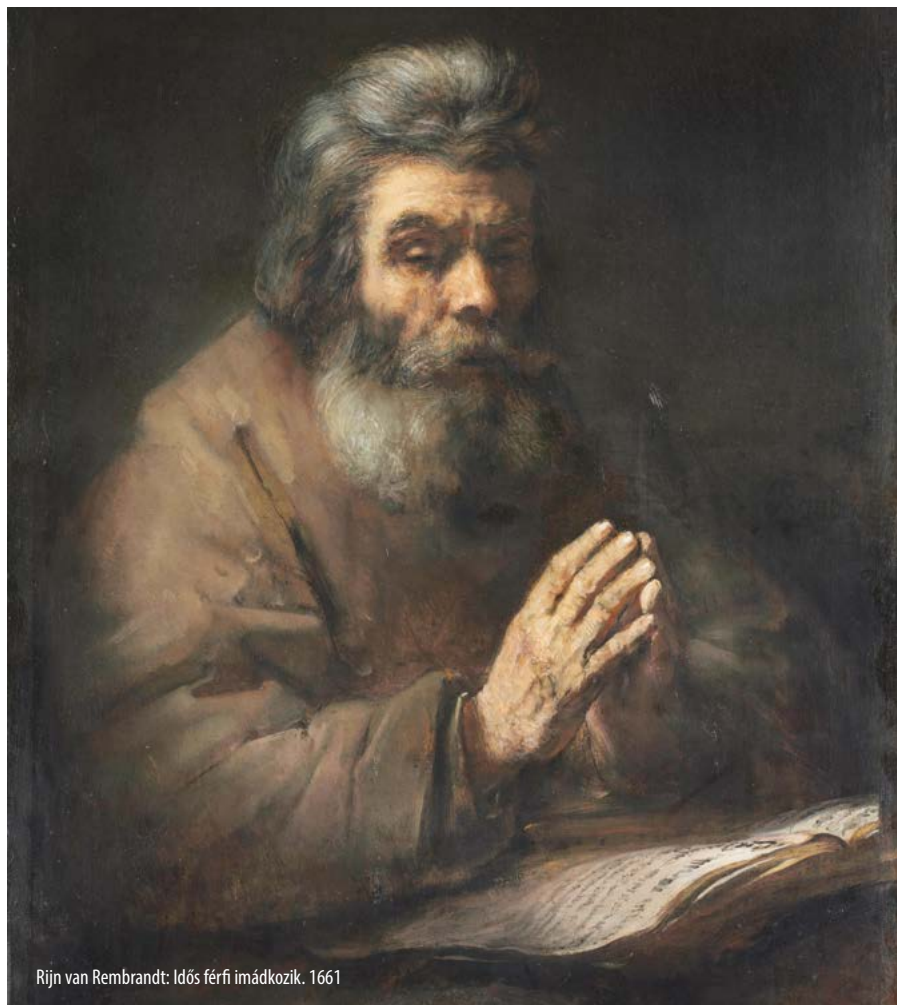
Rijn van Rembrandt: Idős férfi imádkozik. 1661

elképzjük, milyennek tartjuk. Így van ez Istennel is – ezért látjuk őt sokféleképpen. Vigyázzunk: ne tegyük ezt se egymással, se Istennel. Inkább döntsünk ma izgalmasan: meg akarjuk ismerni Istent a valóságában.