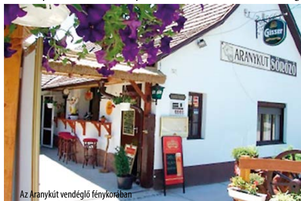
Az Aranykút vendéglő fénykorában

A házat lebontották, majd újjáépítették 1990 táján. Jelenleg hatlakásos családi ház áll a helyén a 2000 évek eleje óta.