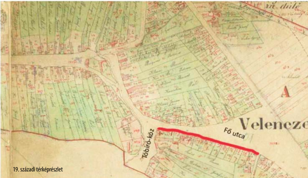
19. századi térképrészlet