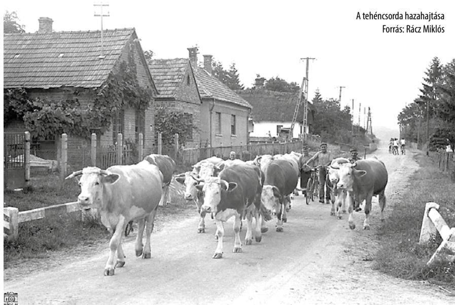
A tehéncsorda hazahajtása

A halászat megszűnése után Velencén is megalakult a Sporthorgász Szövetség, amely megvásárolta az épületet. A horgásztanya irodája és vendégháza kapott benne helyet. Később a Nemzeti Dohánybolt trafikja is ebben a házban volt.